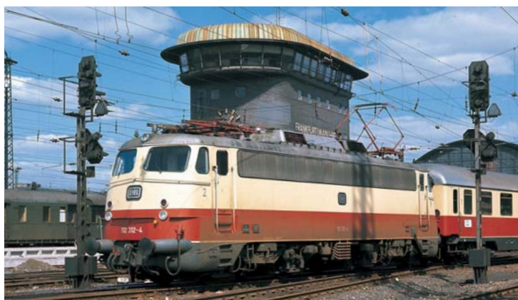
Ellok-Historie E 10.12: Kurze steile Karriere ➔ 26