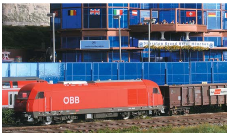
Epoche-V-Anlage: Der Glanz moderner Bahn ➔ 74