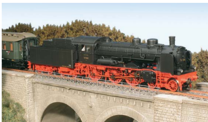
BR 17.10 von Fleischmann: Die andere 17er ➔ 54