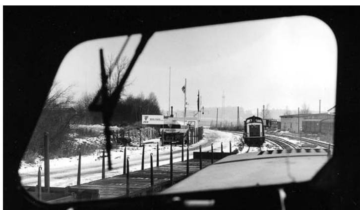
Impressionen: Mit Schub durch die Heimat ➔ 32