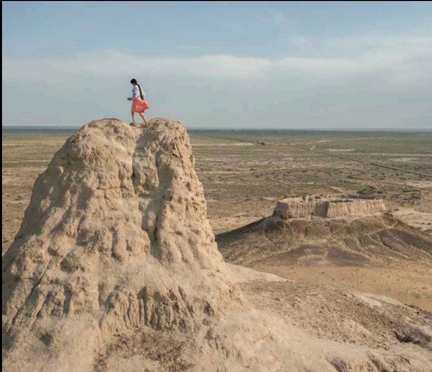
Zitadellen in Usbekistan bergen die Reste eines von Zoroastriern erbauten Feuertempels.