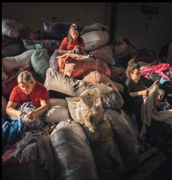
Arbeiterinnen sortieren in Santiago Kleiderabfall.