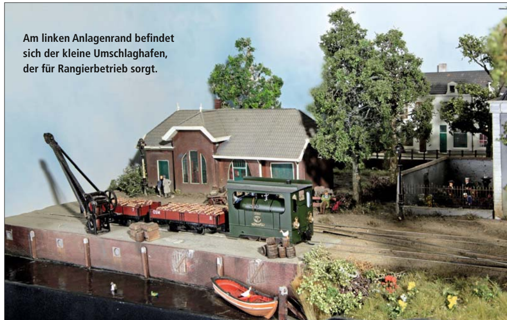
Am linken Anlagenrand befindet sich der kleine Umschlaghafen, der für Rangierbetrieb sorgt.

Eine wahrhafte Bühne für ihre „Backertjes“ genannten kleinen Straßenbahn-Dampflokomotiven schufen die Mitglieder des Modellbahnclubs NEB. Als Vorbild dienten die kleinen Dampfstraßenbahnen, die zu Beginn des 20. Jahrhunderts in den Niederlanden noch zahlreich existierten und unterschiedlichste Güter transportierten – allen voran Torf, der in den niederländischen Mooren zuhauf gestochen wurde.