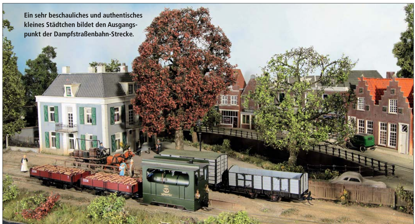
Ein sehr beschauliches und authentisches kleines Städtchen bildet den Ausgangspunkt der Dampfstraßenbahn-Strecke.

Eine Inspirationsquelle fanden wir im Buch „Van Stoomtram tot DVM“, wodurch wir schnell auf die Idee kamen, eine Lokalbahn nach ostniederländischem Vorbild zu Beginn des 20. Jahrhunderts zu bauen. Damals war Torfförderung eine wichtige Einnahmequelle und somit stand das Thema eigentlich fest. Dennoch mussten wir noch viel in Nachschlagewerken stöbern, um uns ein Bild davon machen zu können, wie Landschaft, Straßenbahngleise und Bebauung damals in diesem Teil der Niederlande aussahen.