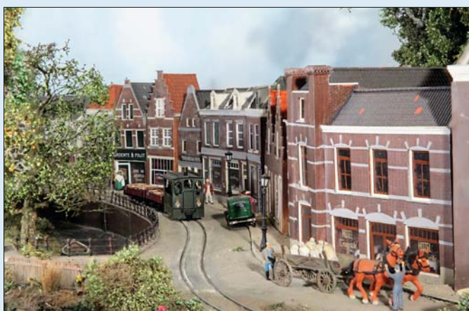
Die Anordnung der Häuserfassaden verleiht der Straße einen glaubhaften Verlauf, weshalb das Hotel auch eine eigenartige Form erhielt.