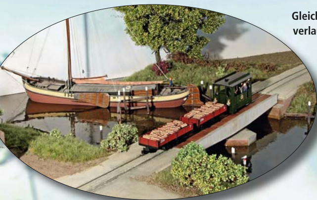
Gleich nach Verlassen des kleinen Städtchens fädelt sich die Strecke wieder in den Straßenverlauf ein und überquert einen landestypischen Kanal über eine drehbare Brücke.

Der grobe Torf war im Land- und Gartenbau zur Verbesserung von Blumenerde geeignet. Zudem konnte man damit den Boden frostfrei halten. Das feine Torfstreu wurde in Ställen als