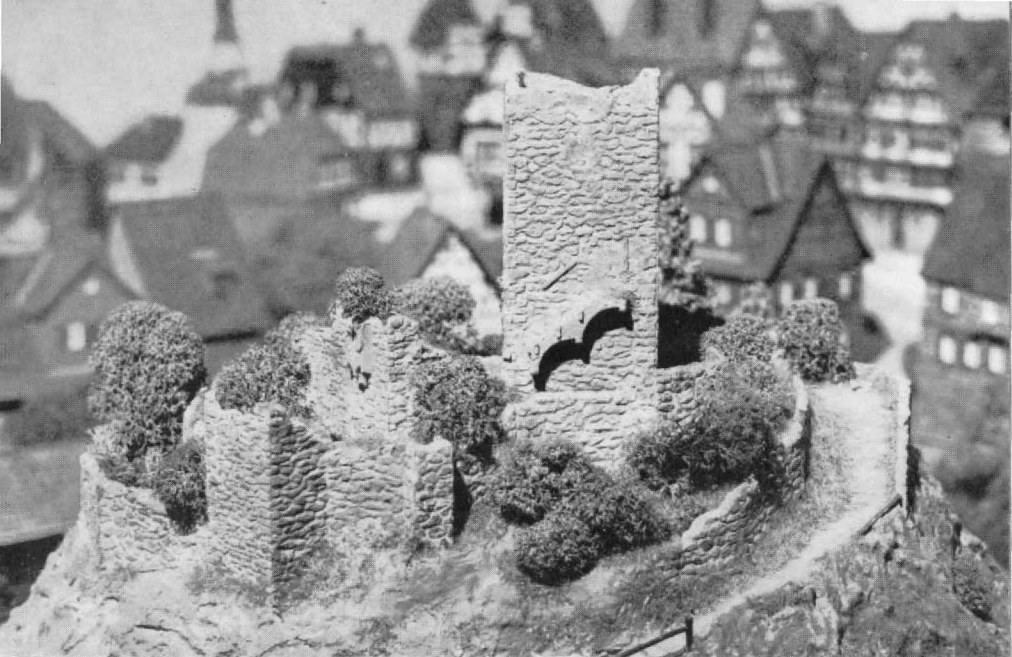
Abb. 1 u. 2. Die „Ruine Rabenstein“ entstand dadurch, daß die Burg „Branzoll“ von Kibri mit Kneifzange und Seitenschneider den mannigfachen Vorbildern in deutschen Landen entsprechend „verwüstet“ wurde; die farbliche Nachbehandlung erfolgte mit braun/grauer (für die „Mörtelritzen“) bzw. ocker/sandsteinfarbener Plakafarbe (für einzelne Steine).