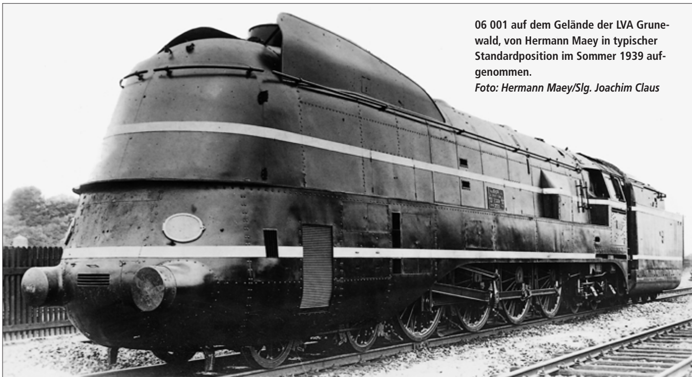
06 001 auf dem Gelände der LVA Grunewald, von Hermann Maey in typischer Standardposition im Sommer 1939 aufgenommen.