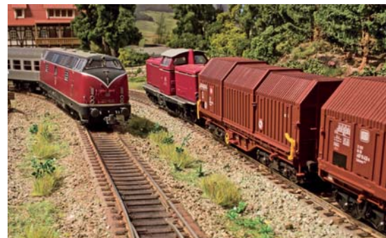
Landschaftsgestaltung Unkraut von Busch

Artikelbenotung 2010 Teilnehmen und eine BR 044 von Roco gewinnen. Siehe Seite 11.