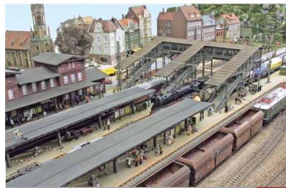
Anlagen-Porträt Action auf der Schiene