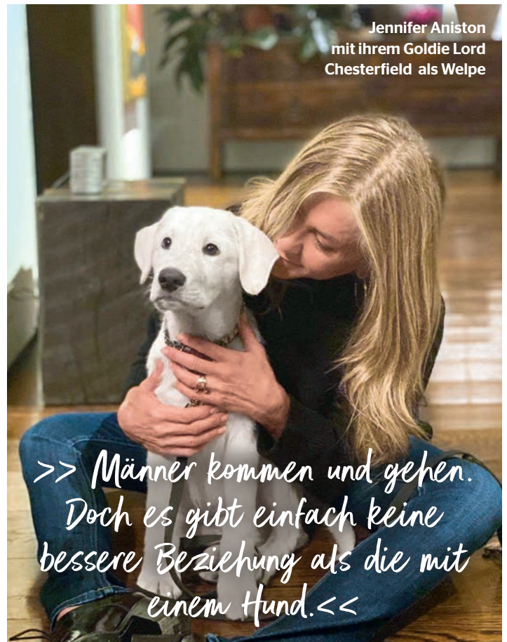
Jennifer Aniston mit ihrem Goldie Lord Chesterfield als Welpe

>> Männer kommen und gehen. Doch es gibt einfach keine bessere Beziehung als die mit einem Hund.<<