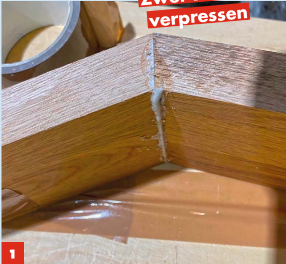
1 Die Verbindungsstellen mit Flachdübeln (Lamellos) und Holzleim oder Konstruktionskleber (PU-Kleber) verbinden.