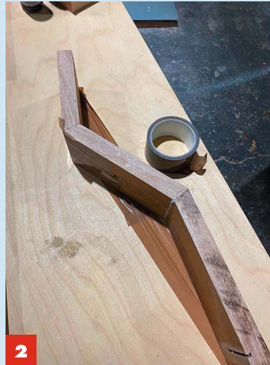
2 Statt mit Zwingen die Verbindungsstellen mit stabilem Paketklebeband fixieren und stabilisieren.