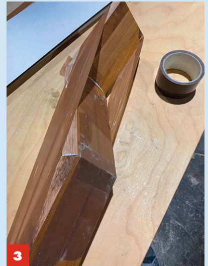
3 Mit mehreren abschließenden Bahnen Klebeband die Winkel zusammenpressen .