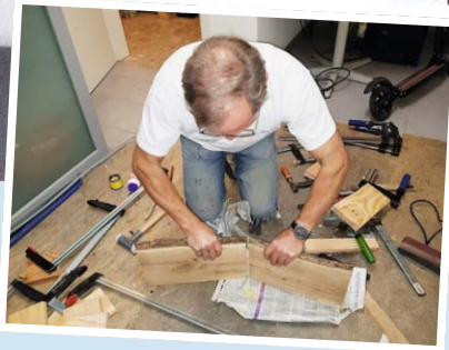
Das Verleimen von zwei schräg abgeschnittenen Latten kann recht aufwendig werden