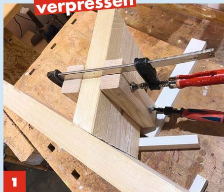
1 Befestigen Sie zwei Lattenabschnitte auf beiden Seiten des zu montierenden Brettabschnittes mit zwei Zwingen.