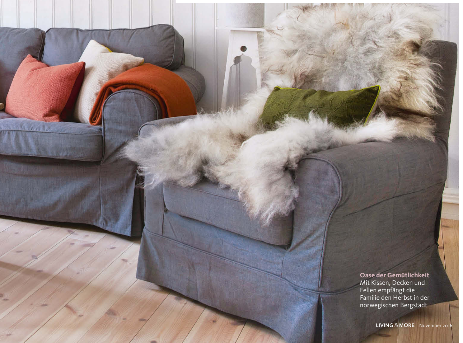
Oase der Gemütlichkeit Mit Kissen, Decken und Fellen empfängt die Familie den Herbst in der norwegischen Bergstadt