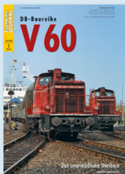
DB-Baureihe V 60 Das unermüdliche Dreibein Best.-Nr. 531402 · € 12,50