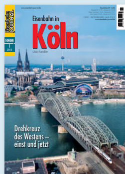
Eisenbahn in Köln Drehkreuz des Westens – einst und jetzt Best.-Nr. 531501 · € 12,50