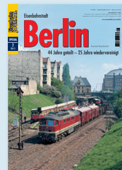
Eisenbahnstadt Berlin 44 Jahre geteilt – 25 Jahre wiedervereint Best.-Nr. 541502 · € 12,50