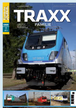
Traxx-Familie Best.-Nr. 531502 · € 12,50