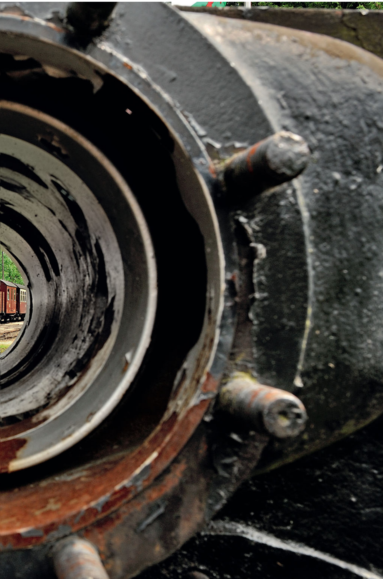
Hasselfelde ist einer der Endbahnhöfe auf dem 140 Kilometer langen Netz der Harzer Schmalspurbahnen. Neben dem gepflegten Empfangsgebäude und dem einständigen Schuppen sind dort noch einige Exponate der Bahn zu sehen, unter anderem ein Zylinderblock einer Lokomotive der Baureihe 99.23–24, durch den hindurch der aus Alexisbad einführende Personenzug, geführt von der 1918 gebauten 99 5609, am 21. Juni 2010 fotografiert wurde.