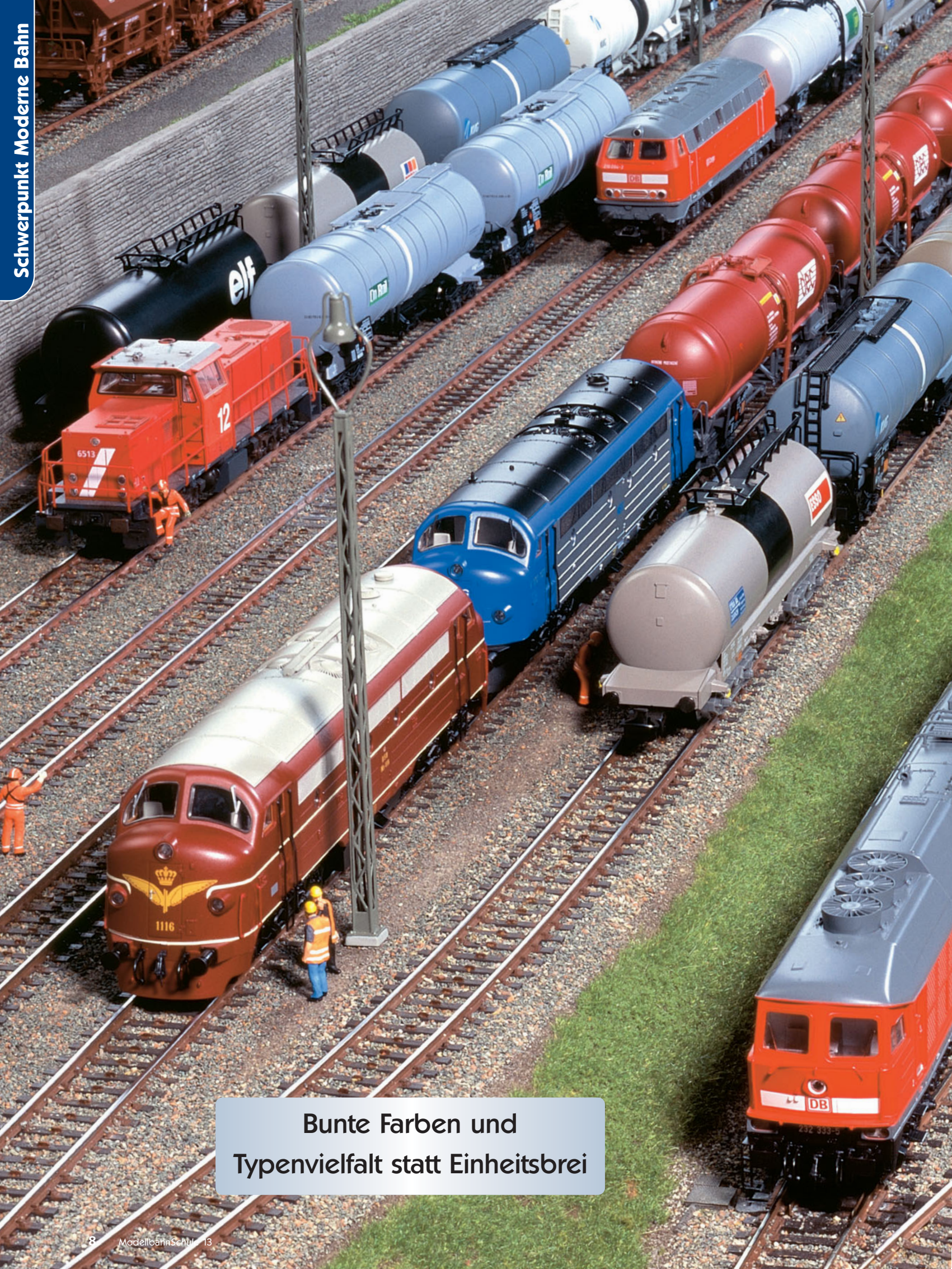
Bunte Farben und Typenvielfalt statt Einheitsbrei